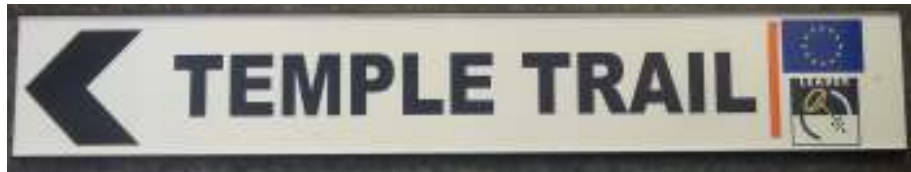
Exempel på skyltning sträckan Ormaggan – Tempelberget

vilken skyltarna hänvisar visar - förutom rikedomens naturinfo - hela Tempelledens sträckning.