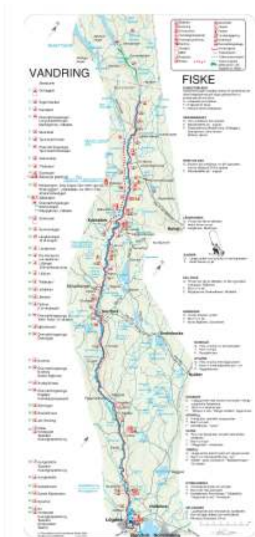
2015 års version av vandringskartan förlängs en mil till Tempelberget i Fredrika

En tillmötesgående attityd till projektet, extra påtagligt hos aktörer inom just området Ormaggan – tempelberget med Fredrika som nav har gynnat förverkligandet av huvudmålsättningens första punkt.