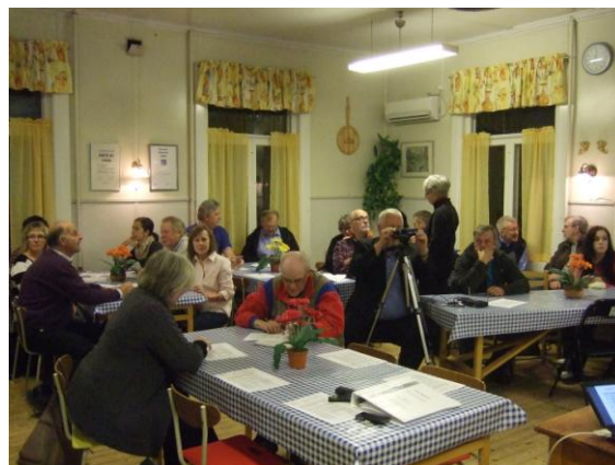
Det första dialogmötet genomfördes i byastugan i Överrödå.

Till inbjudan fogades ett ”underlag till dialog” med uppgifter om bakgrund och syfte med förstudien.