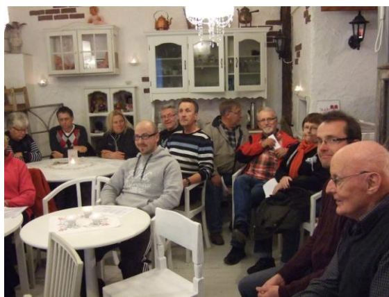
Det var fullsatt i lokalen vid det tredje mötet som genomfördes på Mickelbo Gård.

Mötesserien besöktes av exakt 100 deltagare (enligt närvarolistor för ideell tid per aktivitet) utöver medverkande. Detta utgör hela 27 procent av antalet utsända inbjudningar vilket måste betraktas som mycket bra.